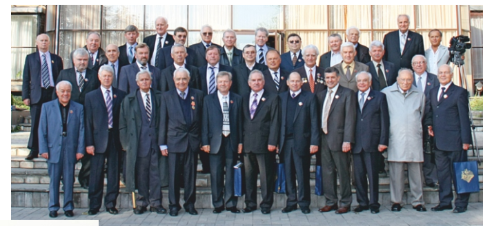
Роботодавці вугільної промисловості різних років