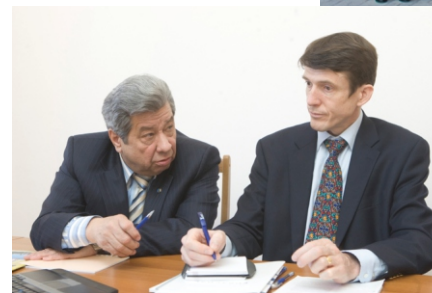
Візит генерального секретаря «EUROCOAL» Брайана Рікеттса